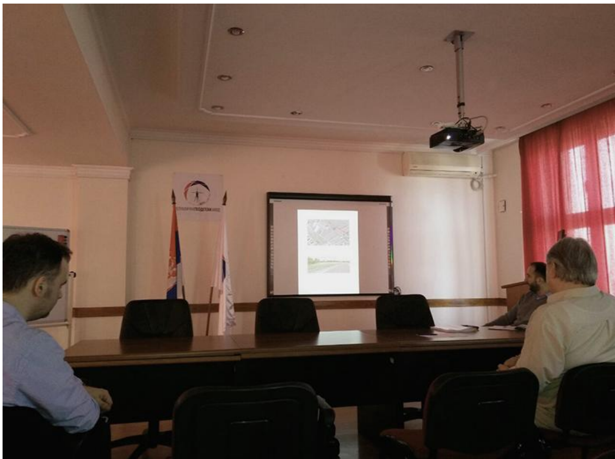
Fotografija Br.1 Javne Konsultacije u sedištu RGZ-a u Beogradu.

Sastanak je počeo prema rasporedu u 10:00 časova. PUŽS dokument sa detaljima je predstavljen zainteresovanim prisutnim od strane predstavnika JIP-a. Tokom javne konsultacije nije bilo značajnijih primedbi ili komentara u vezi sa pitanjima zaštite životne sredine.